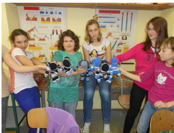
Kroužek textilní a keramické tvorby