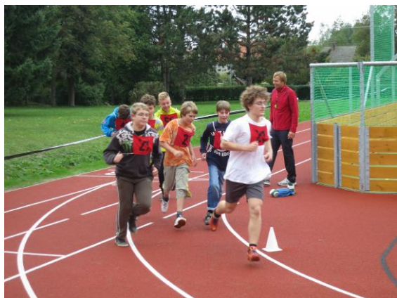
Běh pro zdraví

modrou oblohou, eTwinning) či účast na celosvětové soutěži v programování robotů First Lego League. Ve všech těchto aktivitách dosahují žáci pěkných výsledků. Možnosti využití volného času nabízí i školní knihovna a školní klub.