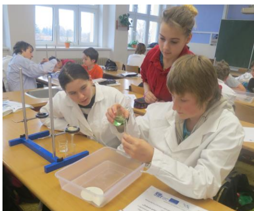
Odborná učebna fyziky a chemie

Současná budova nabízí základní vzdělání až čtyřem stovkám žáků najednou. V jejím vybavení nechybí odborné a polooborné učebny (počítačová učebna s interaktivní tabulí a špičkovým multifunkčním zařízením; učebna přírodopisu taktéž s interaktivní tabulí a videomikroskopem; učebny zeměpisu, chemie a fyziky s kvalitní laboratorní, měřicí a prezentační technikou, cvičná kuchyň, venkovní okrasná zahrada, školní dílny). Ve všech ročnících probíhá výuka dle vlastního školního vzdělávacího programu „Škola pro tebe“.