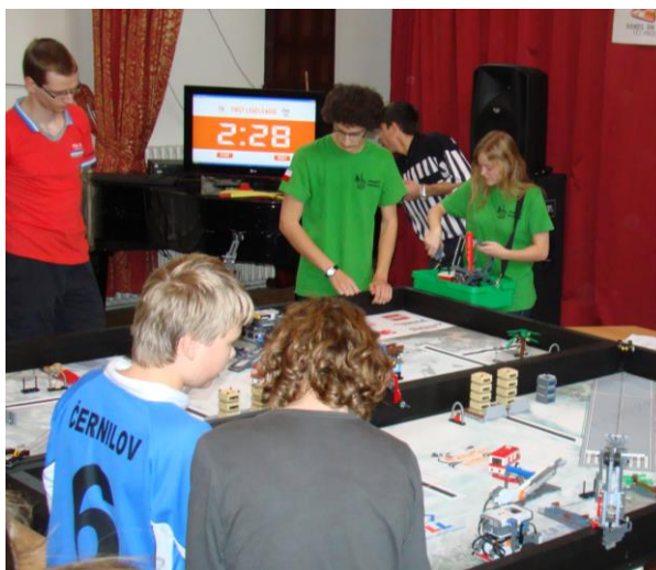
First Lego League