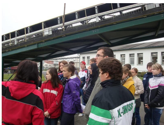
Exkurze v cukrovaru Dobrovice

Na škole pracuje školní parlament. Volení zástupci 2. stupně zde předkládají návrhy pro změny a další akce ve škole.