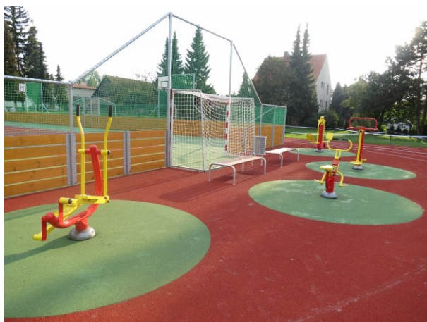
„Odpočinkové“ posilovací stroje