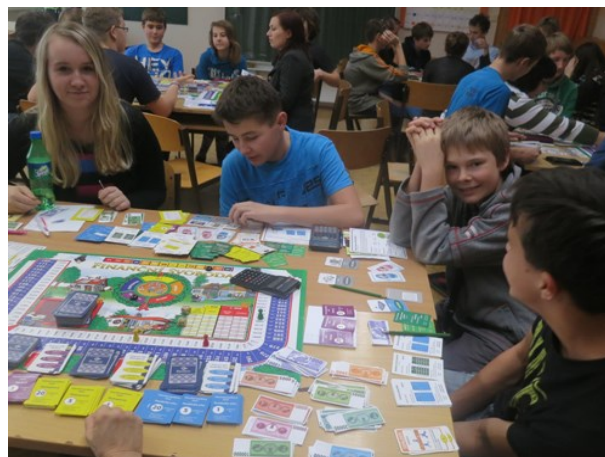
Rozumíme penězům – projektový den