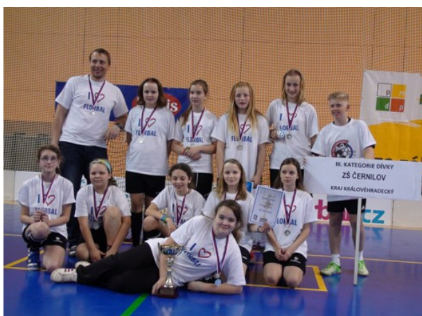
Republikové finále v Plzni – florbal