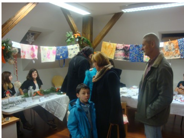
Pracovní dílna – adventní trhy KSD