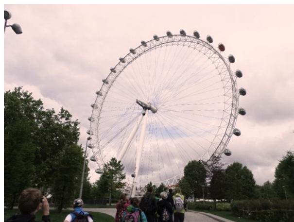
Zájezd Paříž - Londýn