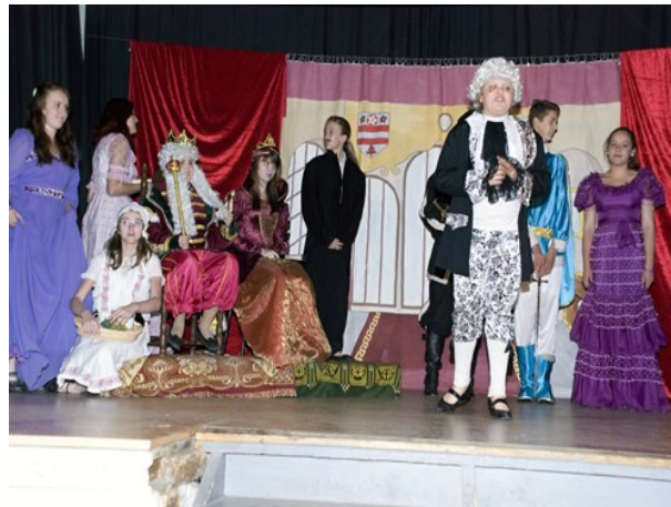
Divadelní představení – sokolovna v Černilově