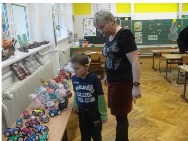
Zápis do prvních tříd