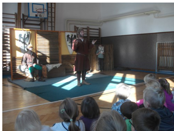
Středověk – představení v tělocvičně