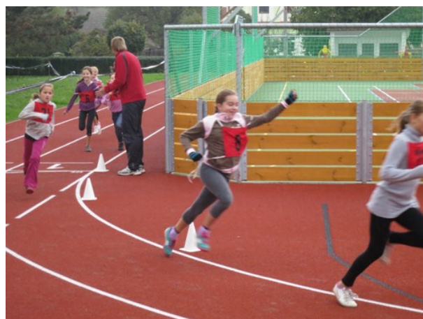
Běh pro zdraví