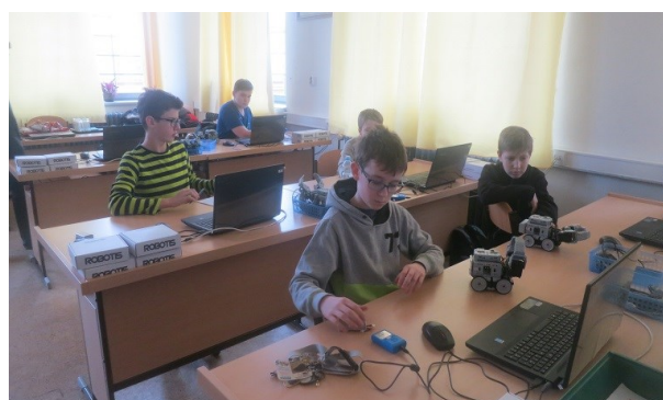
společný projekt se SOU Hradební v HK