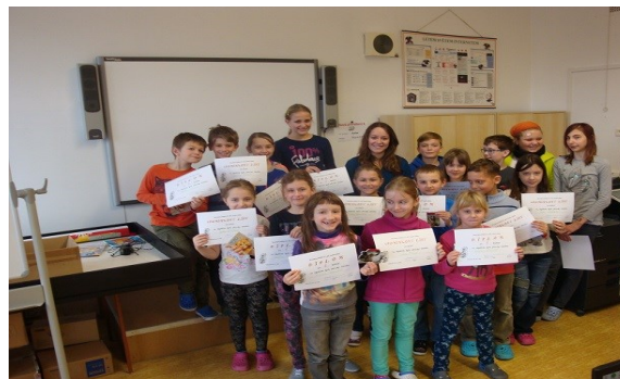
vyhodnocení pěvecké soutěže