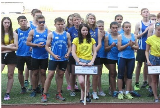
republikové finále v atletickém čtyřboji v Opavě