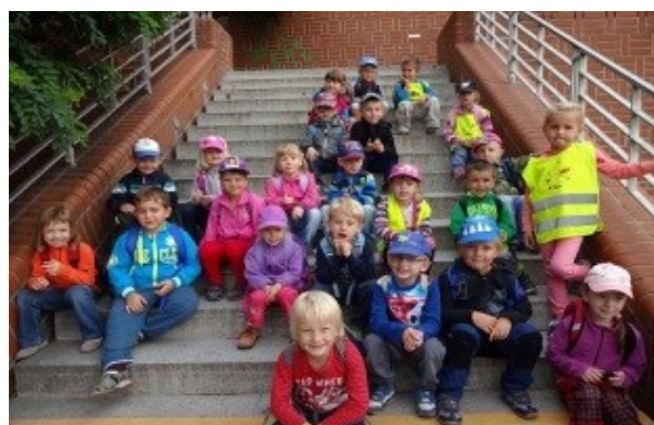
výlet do Hradce Králové