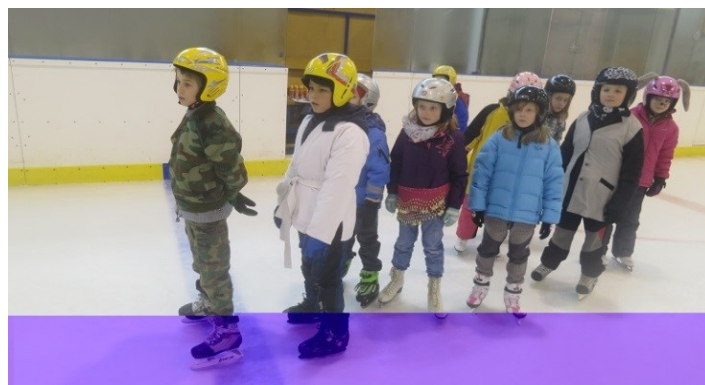
Karneval na ledě