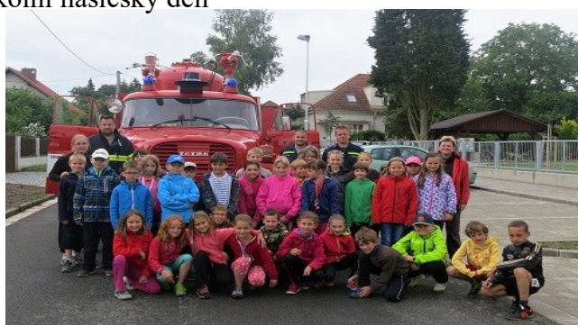
školní hasičský den