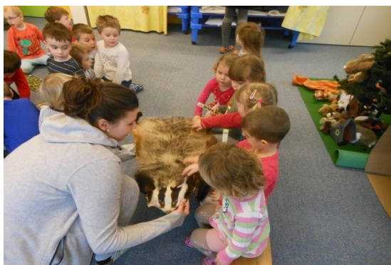
poznávání zvířat s myslivci