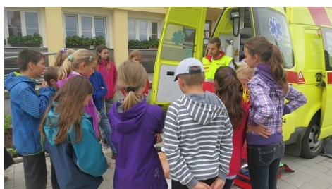
hasičský den (vlevo)