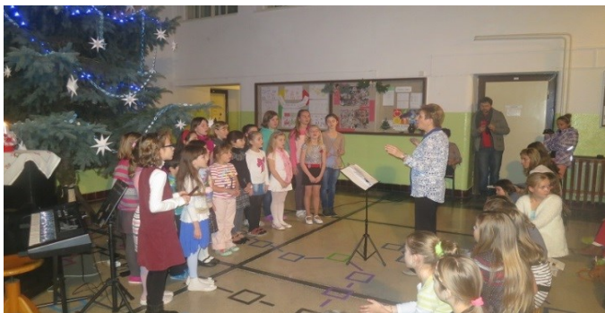
vánoční koncert hale školy