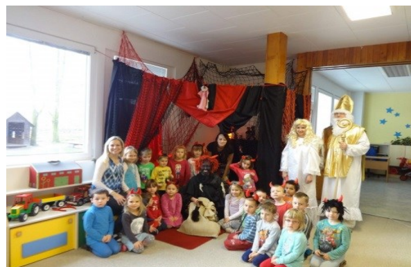
Mikuláš ve školce