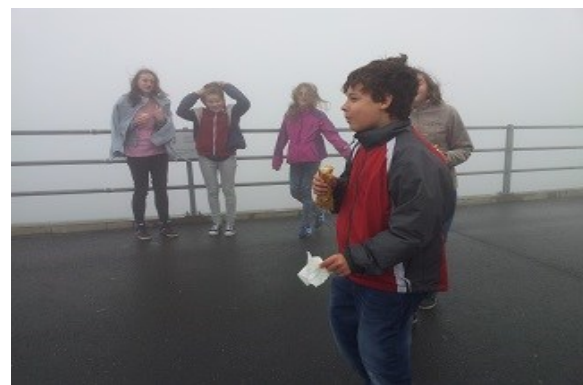
přečerpávací elektrárna Dlouhé Stráně