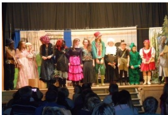
divadelní představení v Černilově