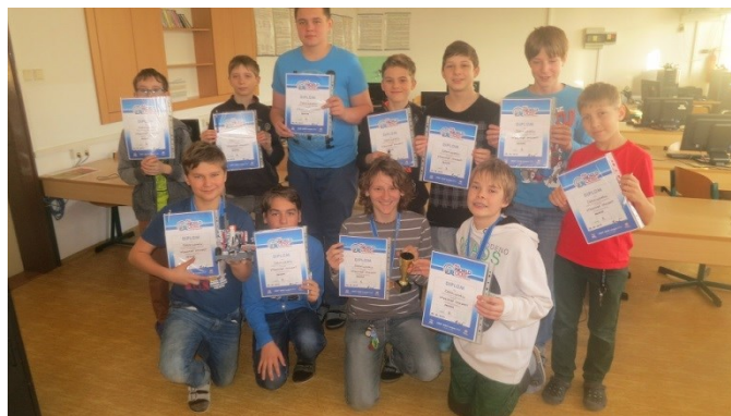
First Lego League 2014 - Praha