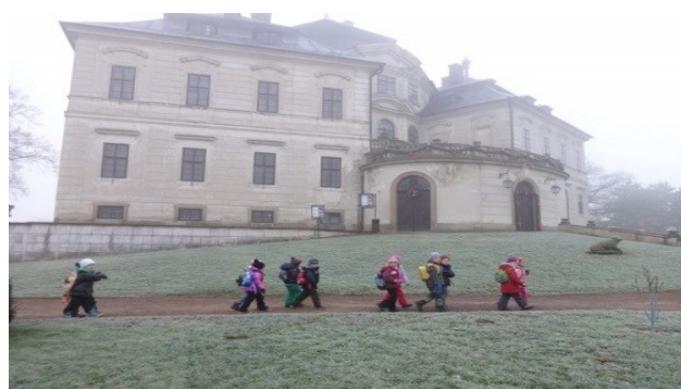
vánoční výlet do Chlumce nad Cidlinou