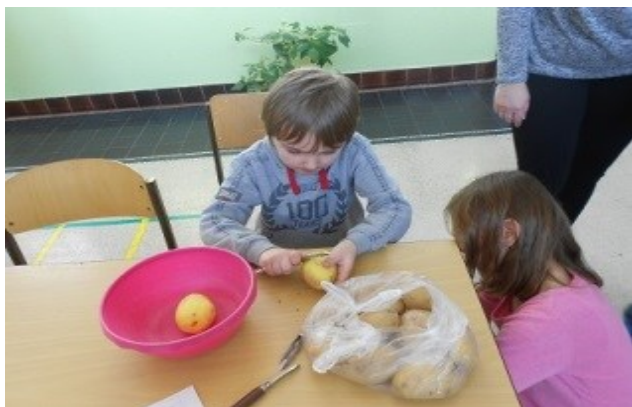
školní soutěž Šíkula