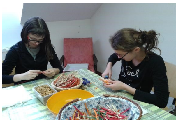
adventní trhy v Černilově