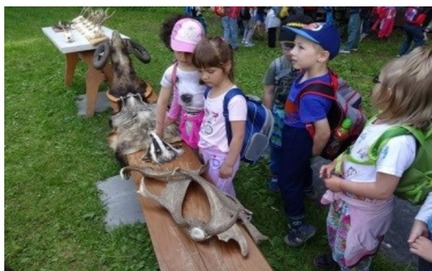
s myslivci v lese