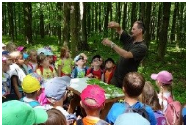
výlet do lesa Kaltouz