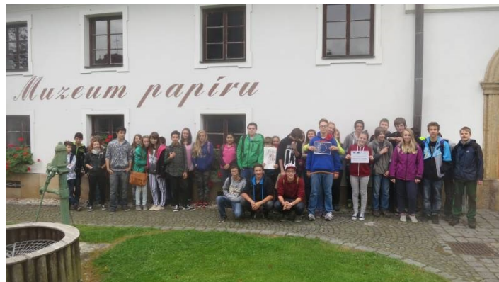
Papírny Velké Losiny