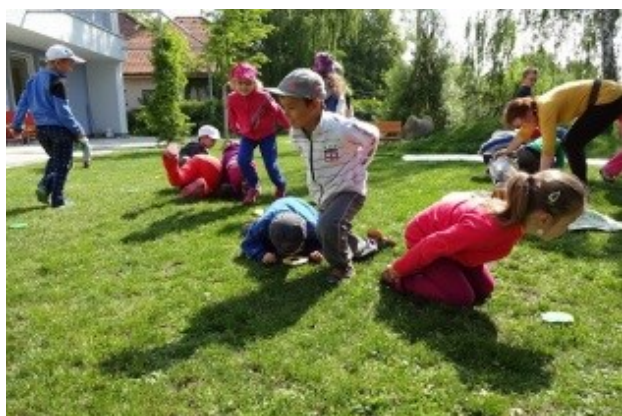
ekologický program ve včelíně