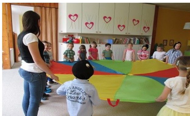
besídka pro rodiče