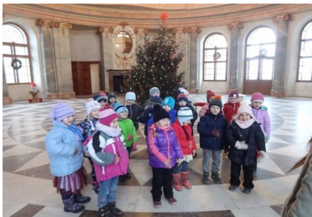
vánoční výlet do Chlumce nad Cidlinou