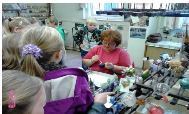
výroba ozdob v Poniklé