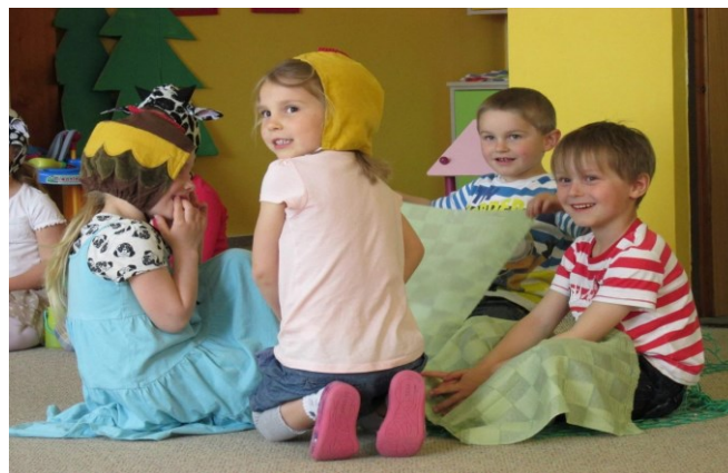
besídka pro rodiče