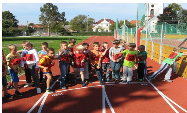
běh pro zdraví