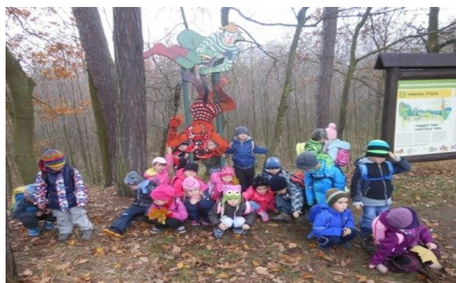
v lese na Biřičce