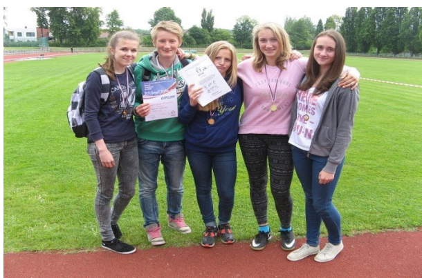
atletický čtyřboj v HK