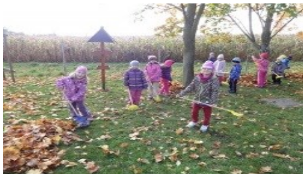
podzimní úklid zahrady