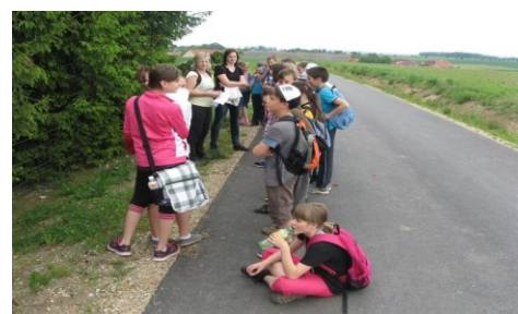
Dětský den (vpravo)