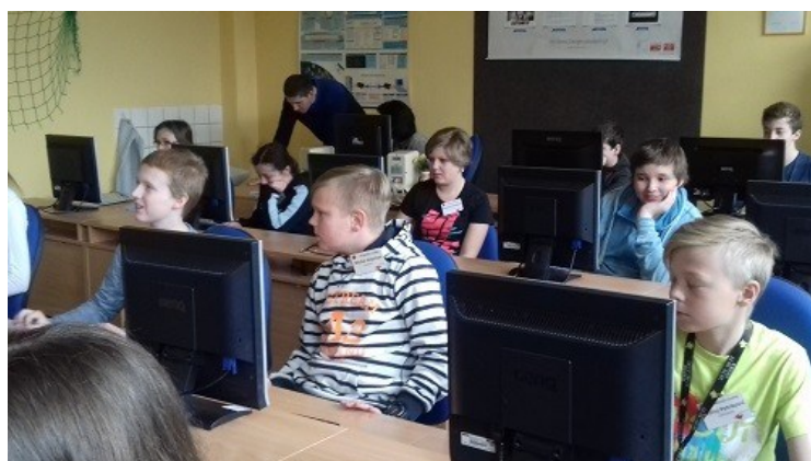
Soutěž v psaní všemi deseti na ZŠ Jiráskova v HK