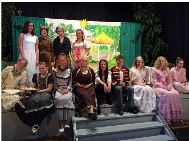
Divadelní představení O princí Bečkovi