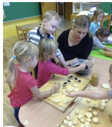
Odpolední akce pro rodiče a děti