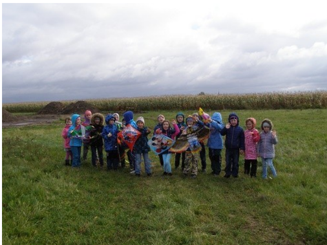
Pouštění draků (1. A)