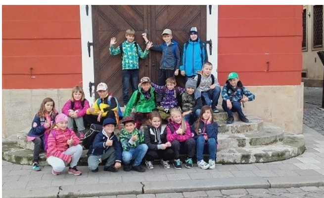
Vláčkem po Hradci Králové (4. třídy)