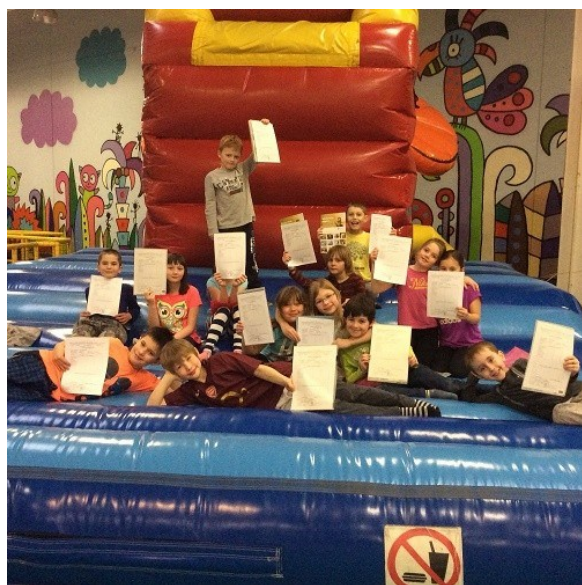
Vysvědčení v Tongu