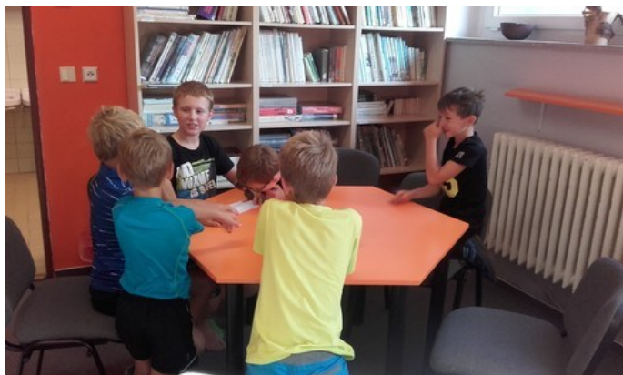
Jazykový příměstský tábor