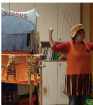
Divadelní představení „Tygr bábovek“ v MŠ