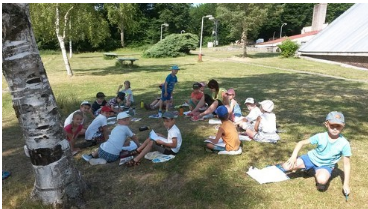
Školní výlet 5. ročníku do Broumovského kláštera