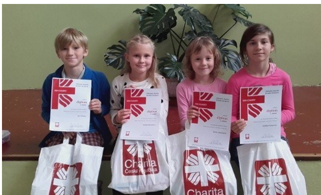
Vyhodnocení výtvarné soutěže pořádané Charitou Hradec Králové