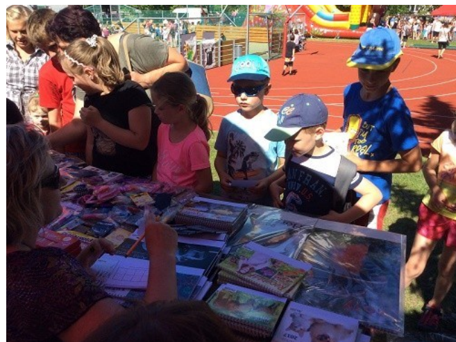
Dětský den 2017