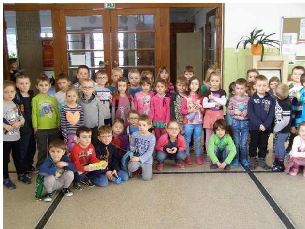
První setkání budoucích prvňáčků