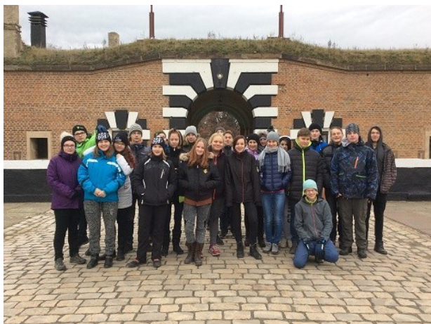
Návštěva Terezína (9. ročník)