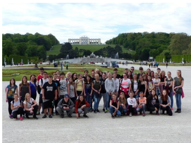
Zájezd do Vídně