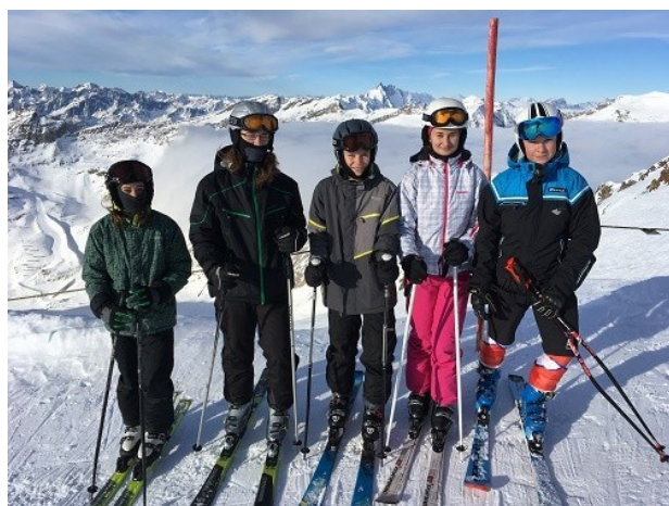
Zájezd do Alp