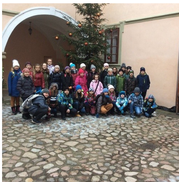
Návštěva zámku Potštejn