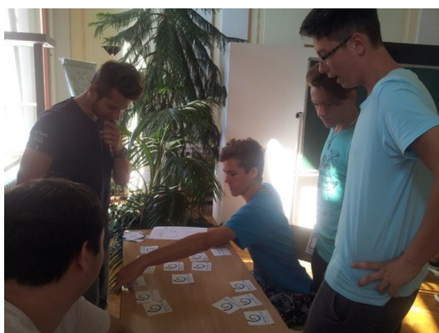
Akce o hospodaření se studentky 3. ročníku Ekonomického lycea OA HK