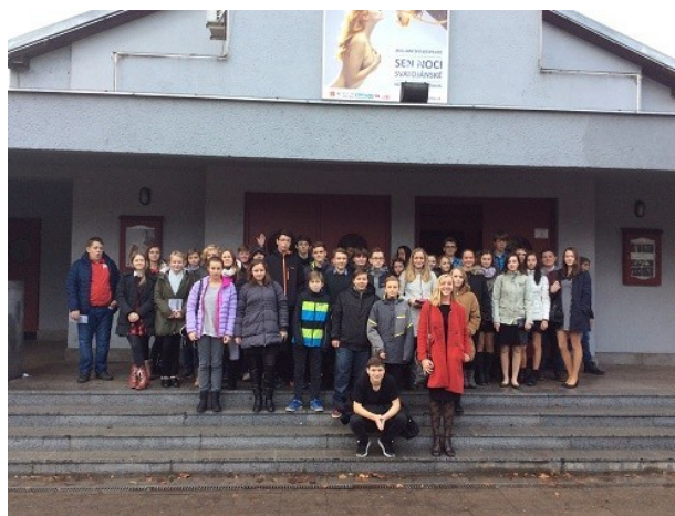
Představení v Divadle na Fidlovačce