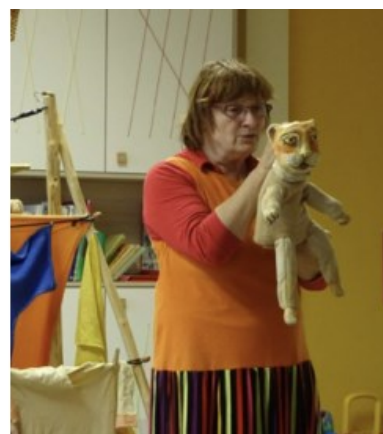
Divadelní představení „Když jde kůže otevřít“ ve Smiřicích