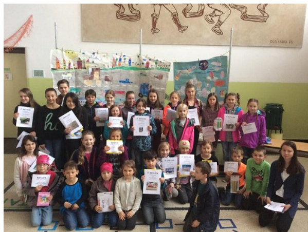
Vyhlášení soutěže Černilovská paleta