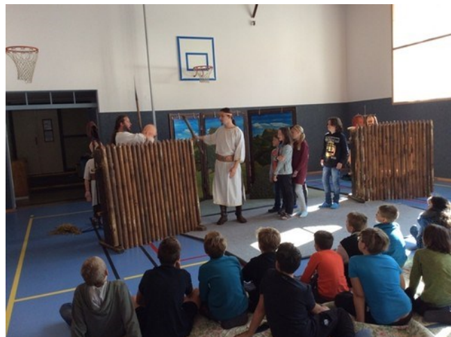
Představení Pernštějní - Staré pověsti české