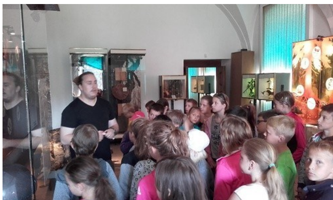
Exkurze do Krkonošského muzea ve Vrchlabí