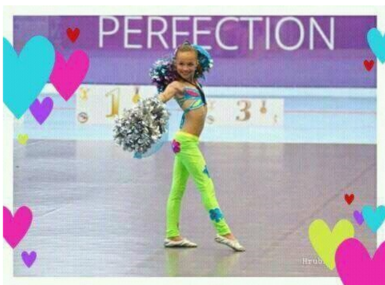
Taneční skupina Creato na Mistrovství světa