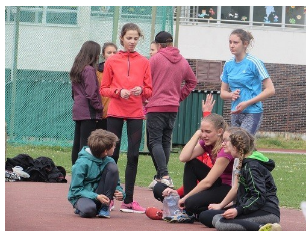
Atletické závody Pohár rozhlasu