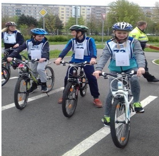
Soutěž mladých cyklistů (9. a 7. ročník)