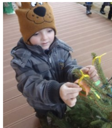
Návštěva „Adventních trhů“ ve Spolkovém domě