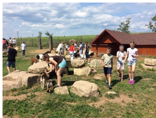
7. ročník na výletě ve FAJN parku – Chlumec nad Cidlinou