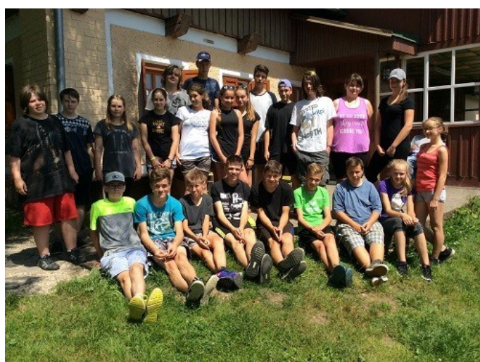
8. ročník na sokolské chatě