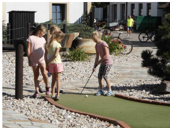
Jazykový příměstský tábor