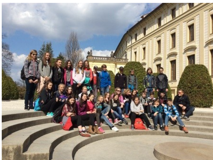
Návštěva Pražského hradu (7. ročník)