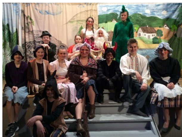
Divadelní představení Byl jednou jeden drak