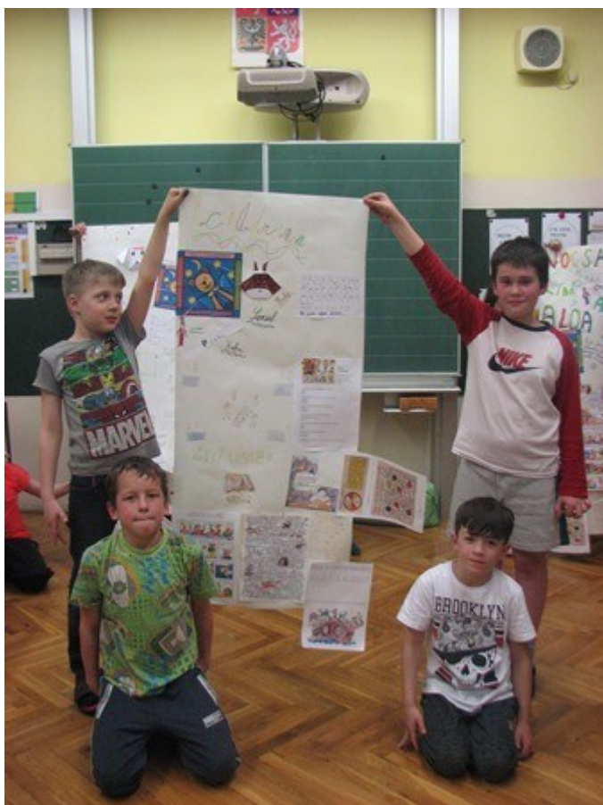
Noc s Andersenem