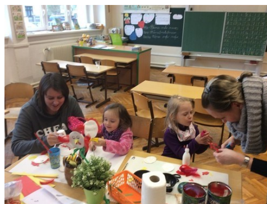
Den otevřených dveří 2017