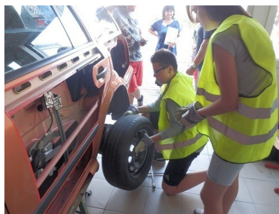
Akce "Den pro Vás" na SOŠ a SOU Vocelova