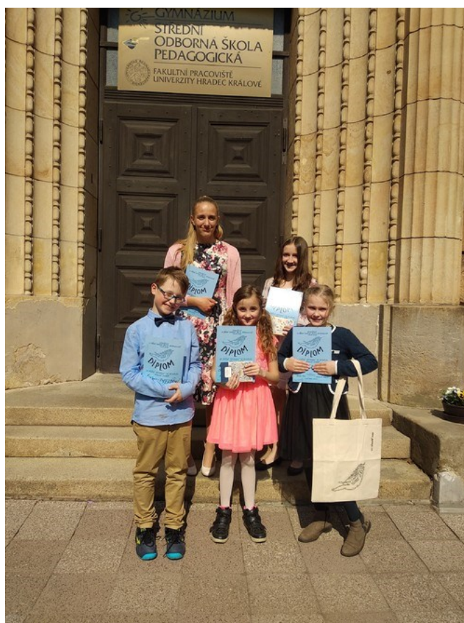
pěvecká soutěž Zlatý slaviček