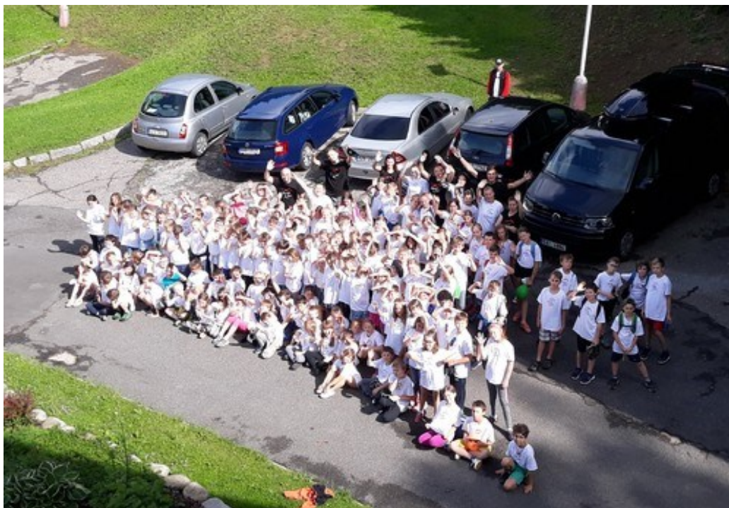
škola v přírodě