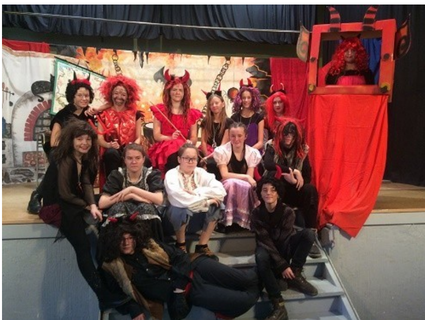
divadelní představení dramatického kroužku