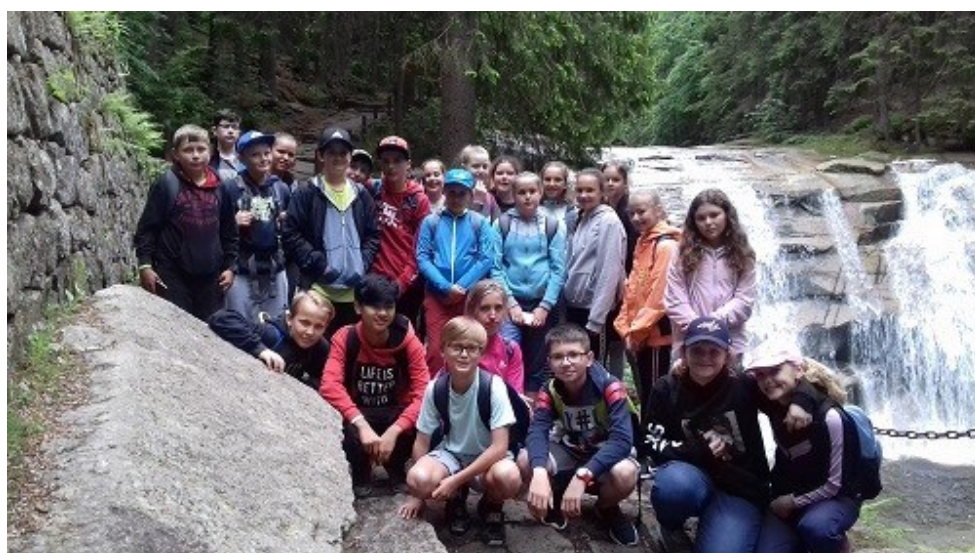
výlet do Harrachova