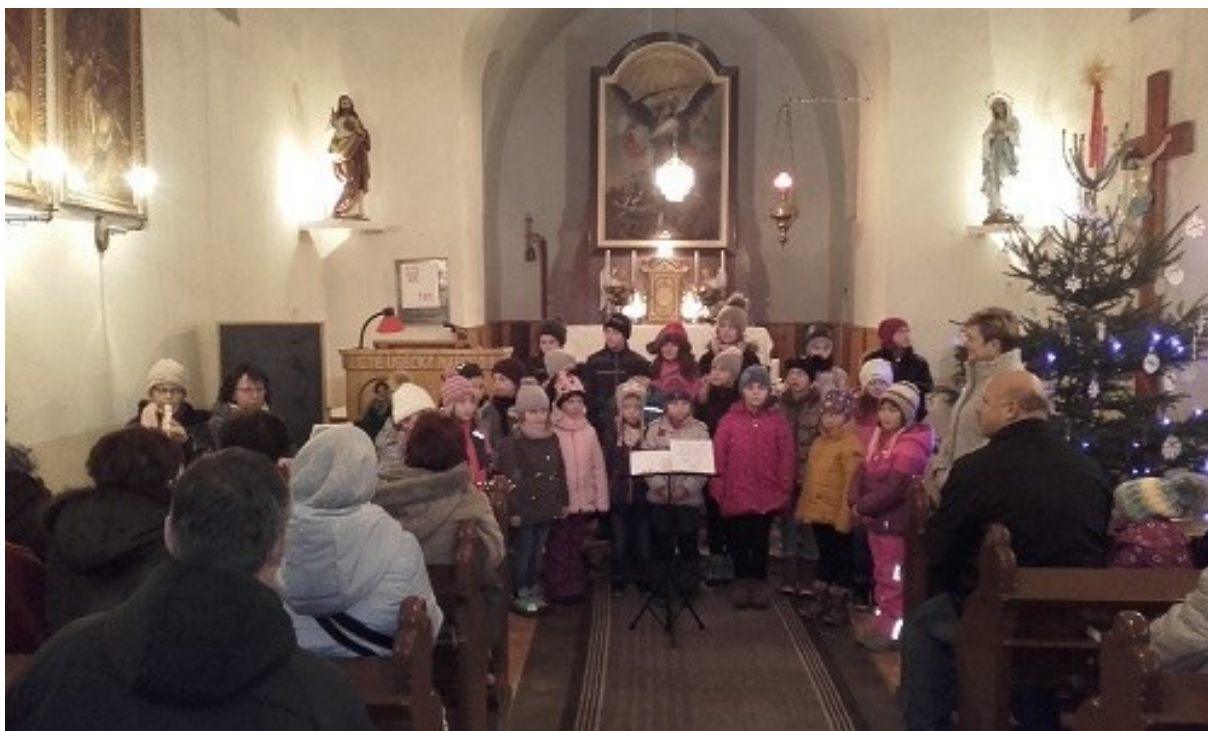
vánoční koncert v Libřicích