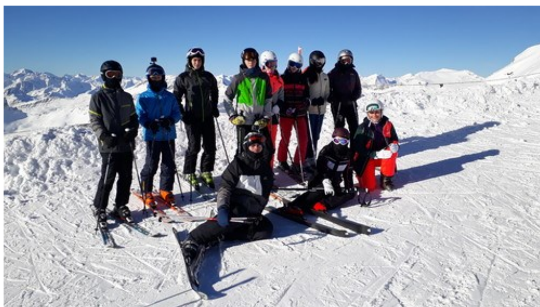
lyžařský zájezd do Alp