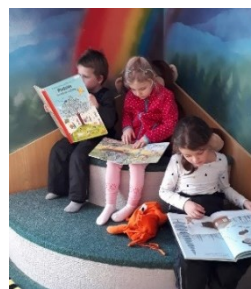
návštěva knihovny v Černilově