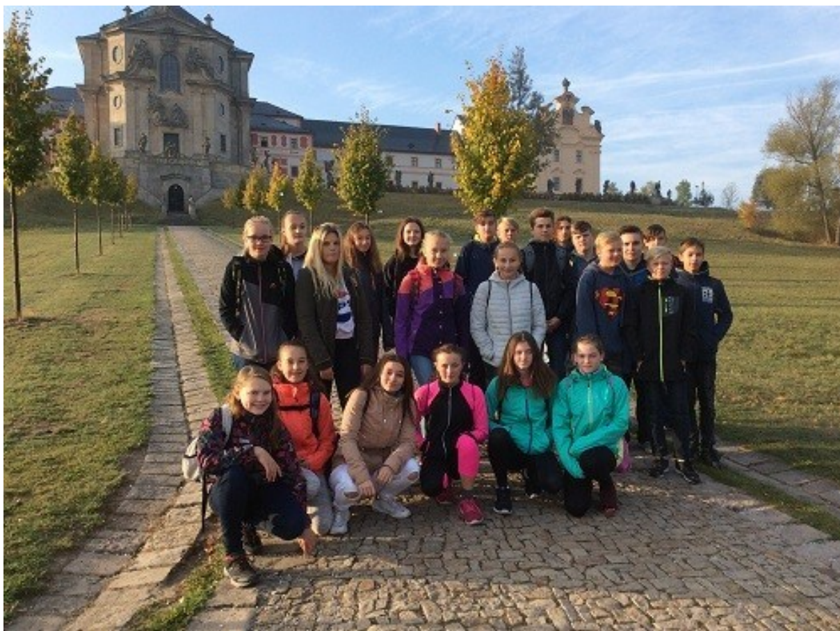
poznáváme historii - Kuks