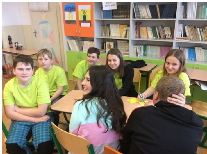
setkání žákovských parlamentů