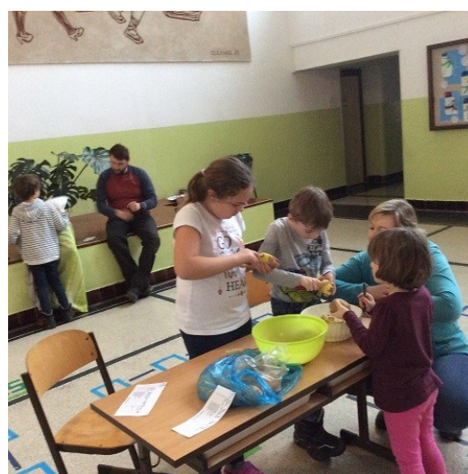
soutěž Největší šikula