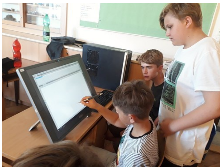
kyber dílny u nás ve škole