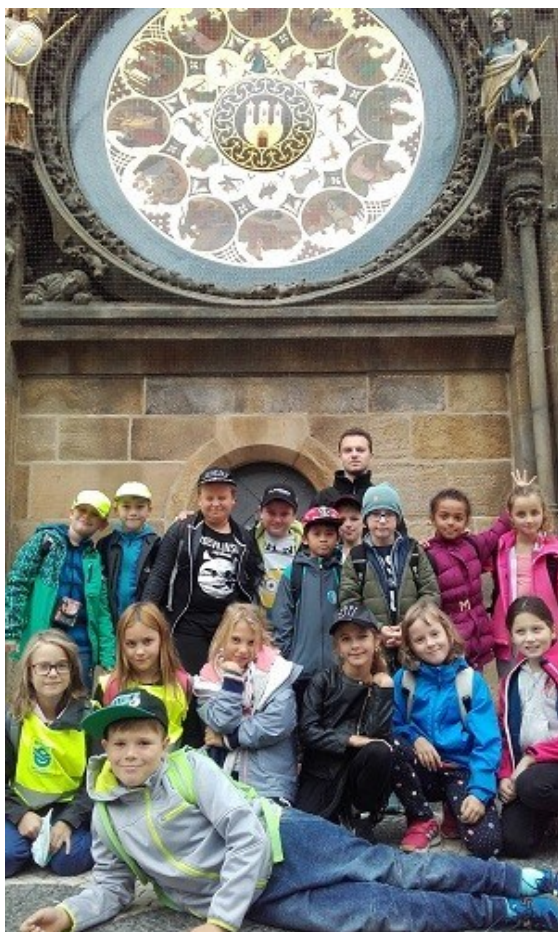
výlet do Prahy