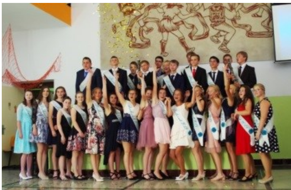
loučení žáků 9. ročníku