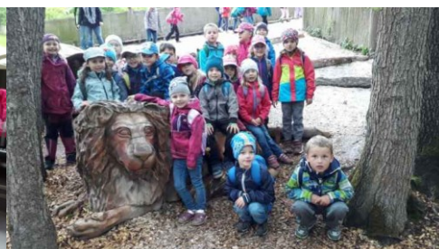
den dětí v MS – soutěžní dopoledne na zahradě