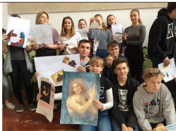
Projektový den Leonardo da Vinci