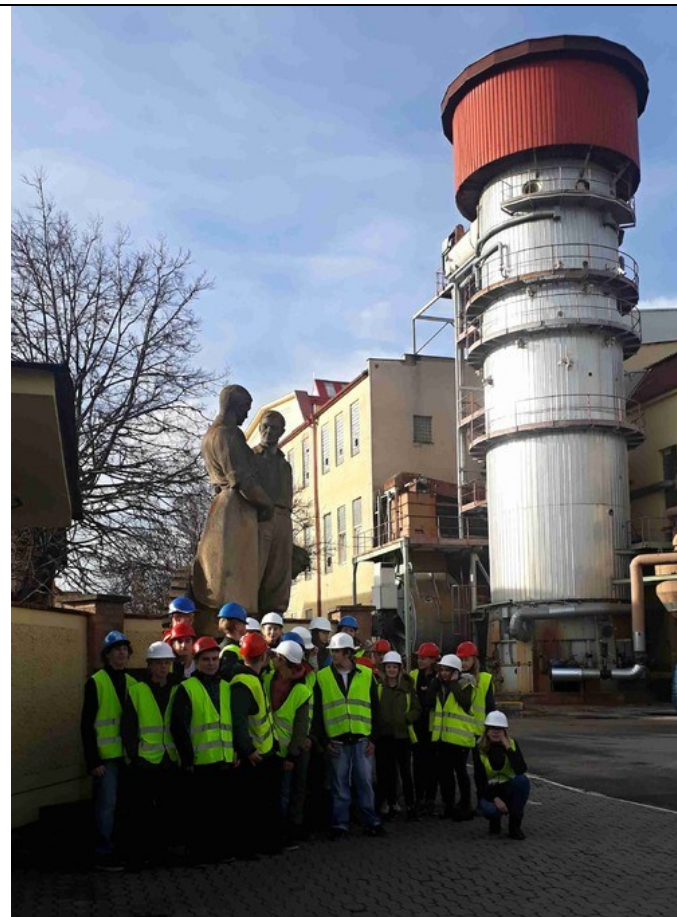
Cukrovar v Českém Meziříčí