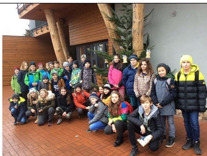
Vánoční ZOO Dvůr Králové nad Labem