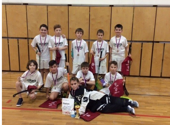
Krajské finále ve florbale