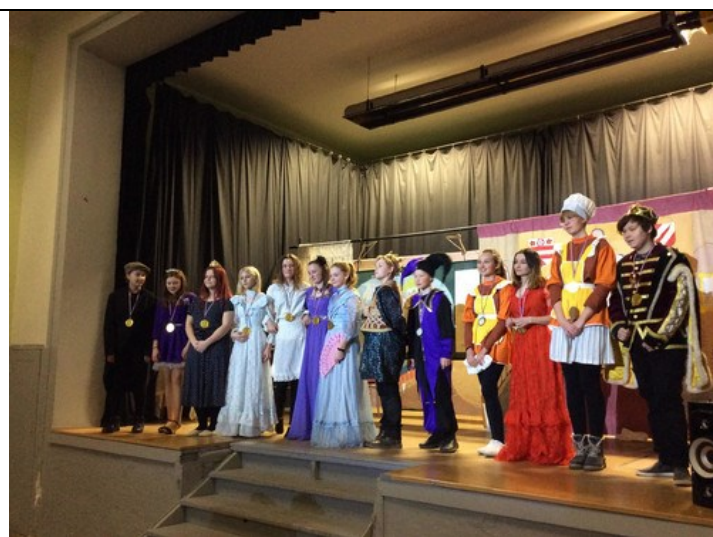
Představení dramatického kroužku