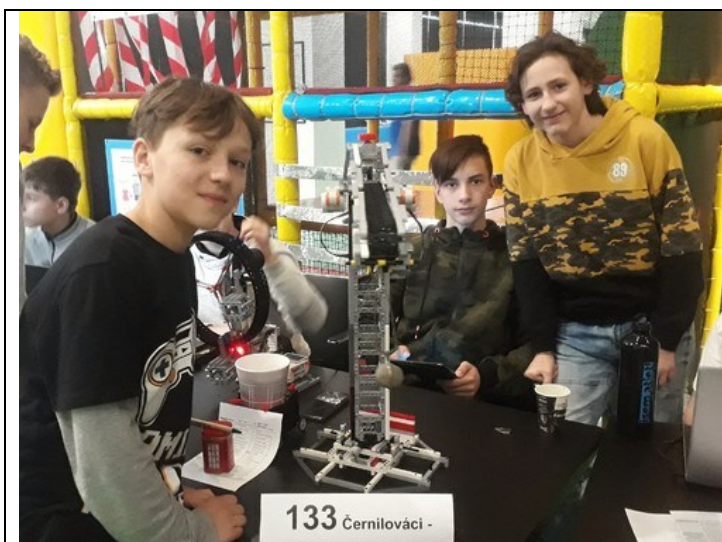
Robotiáda v Brně